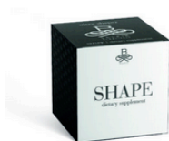
B-Selfie Shape mockups-design.com