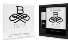
GlamSet B-SELFIE Eyes