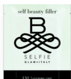
busta B-SELFIE EYE