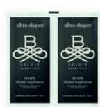
B-SELFIE SHAPE busta