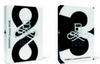
B-SELFIE beauty mask