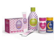
B-SELFIE Linea Sweeties therapy